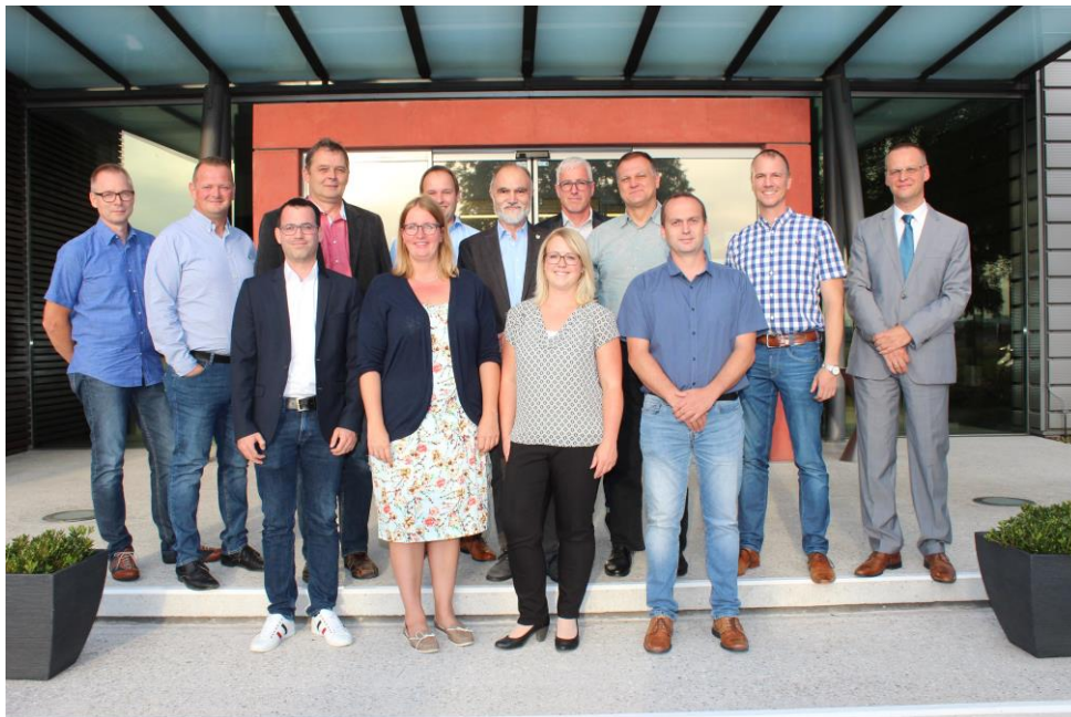
Das Bild wurde am 19.07.2019 bei der Konstituierenden Sitzung aufgenommen

In Cleebronn setzt sich der Gemeinderat aus dem Bürgermeister als Vorsitzenden und 12 gewählten Mitgliedern zusammen. Nach der Kommunalwahl am 26.05.2019 entfallen 4 Sitze auf die CDU , 3 Sitze auf die FWV, 2 Sitze auf die AGU und auf die PC 3 Sitze.